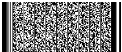
Timbre electrónico SRCel

Verifique documento en www.registrocivil.gob.cl o a nuestro Call Center 600 370 2000, para teléfonos fijos y celulares. La próxima vez, obtén este certificado en www.registrocivil.gob.cl .